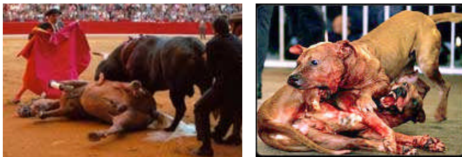
combat de chiens