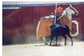
Kind als Stierkampfschüler

Im Namen einer schlimmen Tradition unterweisen wir unsere Kinder zu quälen